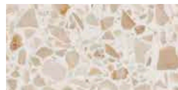
lucido / polished / poliert